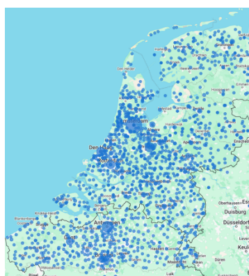
Spreiding van scholen die KUNSTOPJEBORD gebruiken (2020 -2024)